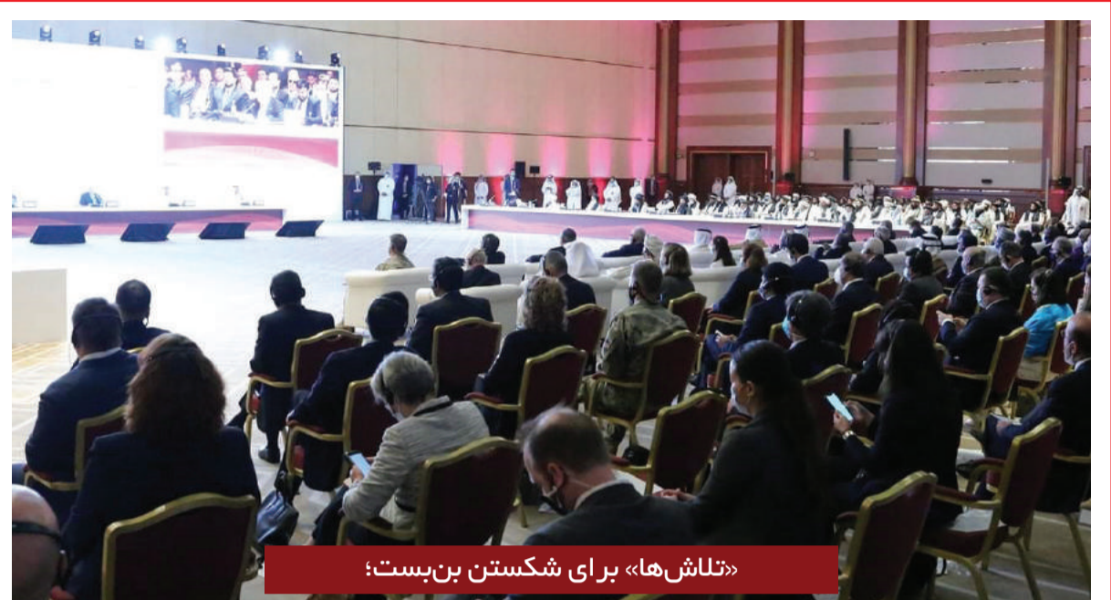
«تلاش ها» برای شکستن بن بست؛