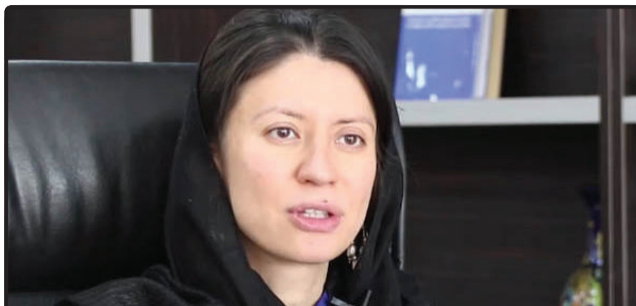
گفت و گوی شبکه‌ی جامعه‌ی مدنی و حقوق بشر با شهرزاد اکبر رئیس کمیسیون مستقل حقوق بشر افغانستان

بر این است که طرف‌های مذاکره باید تلاش کنند که اختلافات خود را از راه گفت‌وگو حل کنند؛ زیرا در وضعیت کنونی، کم‌هزینه‌ترین راه حلی که در آن حقوق بشر حفظ شود، ادامه‌ی گفت‌وگوها و به نتیجه رسیدن آن است. ادامه‌ی جنگ و خون‌ریزی، مردم کشور، به‌ویژه غیرنظامیان را متضرر می‌کند، آمار بالای تلفات ملکی، معلولیت‌های ناشی از جنگ و وضعیت بی‌جاشده‌گان در اثر جنگ از عوامل نگرانی در حوزه‌ی حقوق بشر است؛ بنابراین دوام گفت‌وگوهای صلح و به نتیجه رسیدن آن بسیار مهم است؛ البته دوام مذاکرات در حالتی که هیچ تغییری در زنده‌گی روزمره‌ی مردم نیاید و اعتماد شهروندان به روند صلح به دلیل افزایش خشونت‌ها کاسته شود، سودی ندارد. در حال حاضر گفت‌وگوهای صلح از مشروعیت لازم برخوردار نیست و دلیل عمده‌اش این است که این مذاکرات در بیرون از افغانستان اتفاق می‌افتد و جنگ در داخل افغانستان هر روز از مردم قربانی می‌گیرد، خشونت‌های وحشتناک و غیرقابل تصویری اتفاق می‌افتد و جنایات جنگی ادامه دارد. چیزی که می‌تواند امکان کامیابی گفت‌وگوها را افزایش دهد، پایان یافتن خشونت و خون‌ریزی است؛ باید در جریان گفت‌وگوها خشونت توقف یابد و آتش‌بس برقرار شود و برای کاهش خشونت تعهد وجود داشته باشد.