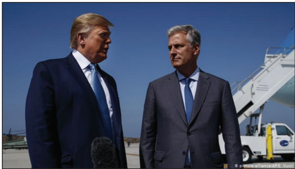
اپویراین همچنین از تیم همکاران جو بایدن در کاخ سفید تعریف کرده و گفته است: «آن‌ها افراد حرفه‌ای برای اشغال پست‌ها در کاخ سفید را در اختیار دارند. بسیاری از آن‌ها پیش از نیز مدت‌ها در کاخ سفید مشغول به کار بوده‌اند.»

رابرت اوپراین، مشاور امنیت ملی امریکا اعلام کرد که در صورت تأیید پیروزی بایدن، به انتقال رسمی و آرام قدرت متعهد است. اوپراین همچنین تیم جو بایدن را تیمی حرفه‌ای خواند که پیش از این نیز در کاخ سفید فعالیت داشته‌اند. به‌رغم گذشت دو هفته از انتخابات ریاست جمهوری امریکا، دونالد ترامپ همچنان از پذیرش شکست خود در این انتخابات اجتناب می‌ورزد. این در حالی است که شماری از نزدیکان و همکاران او بر این باورند که ترامپ ناگزیر به پذیرش نتایج این انتخابات خواهد شد. رابرت اوپراین، مشاور امنیت ملی کاخ سفید در همایش دیجیتال "امنیت جهانی" از انتقال رسمی و برنامه‌ریزی شده قدرت به دولت جدید سخن گفته است. گفته شده است که حتی در صورت عدم پذیرش شکست از سوی ترامپ، انتقال قدرت به شکل آرام به تیم بایدن در کاخ سفید صورت خواهد گرفت. اوپراین در سخنرانی خود تأکید کرده است که انتقال رسمی قدرت به تیم بایدن منوط به اعلام رسمی نتایج این انتخابات خواهد بود. او هنوز پیروزی بایدن در این انتخابات را قطعی نمی‌داند. این در حالی است که بر اساس نتایج اعلام شده، جو بایدن کارزار انتخابات ریاست جمهوری را آشکارا به سود خود به