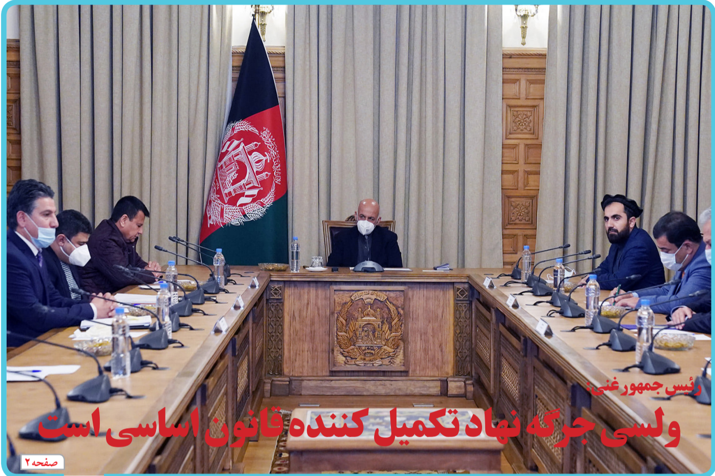
رئیس جمهور غنی