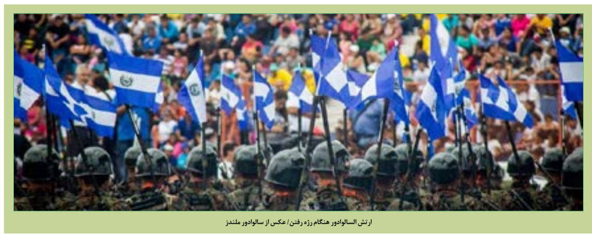
ارتش السالوادور هنگام رژه رفتن

این گروه بین سال‌های ۱۹۸۳ و ۱۹۸۷ پیشنهادهایی راجع به غیرنظامی‌شدن، پایان مداخله خارجی و ارزش گفت‌وگو ارائه داد که به تدریج مذاکرات منطقه‌ای صلح را مشروعیت