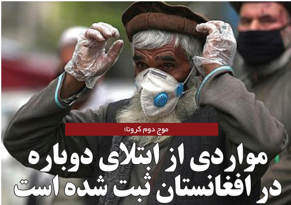
موج دوم کرونا؛