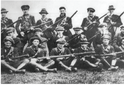
عکسی از ارتش جمهوری‌خواهان کاتولیک ایرلند شمالی

ترور می‌کردند. بریتانیا در نخست تلاش می‌کرد تا با اعزام نیروهای بیش‌تر به ایرلند شمالی، مناقشات را مدیریت کند، اما زمانی که دامنه مبارزات مسلح جمهوری‌خواهان کاتولیک و درگیری‌ها به قلب لندن رسید، رویکرد دولت بریتانیا نیز تغییر کرد.