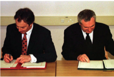
امضای توافق‌نامه صلح ایرلند شمالی در ۱۰ اپریل ۱۹۹۸

تونی بلر، از حزب کارگر با یک پیروزی چشم‌گیر در انتخابات سراسری ۱۹۹۷ توانست بر جان میجر غلبه کند و به ۱۸ سال حکومت حزب محافظه‌کار بریتانیا پایان دهد. یک سال بعد آقای بلر حل مناقشه ایرلند شمالی را با اشتراک چهره‌های بین‌المللی تأثیرگذار در روند مذاکرات، مهم و عملی دانست. به همین دلیل با تکیه بر طرح سناتور جورج میچل آمریکایی که از سال گذشته آن را اجرایی کرده بود، کمیسیون بین‌المللی به هدف خلع سلاح تمام نیروهای شبه‌نظامی در ایرلند شمالی ایجاد کرد.