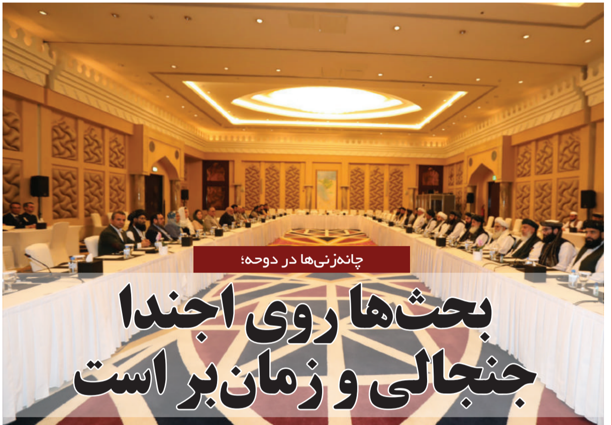
چانهزنی‌ها در دوحه؛