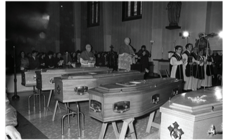
تابوت‌های ۱۳ مظاهرکننده در یک‌شنبه خونین

ریشه مناقشات و تعارض در ایرلند شمالی، به شکاف سیاسی ایدیولوژیک، نژادی-مذهبی و هویتی برمی‌گشت. این موضوعات به وسیله اختلافات عمیق میان پروتستان‌های طرفدار بریتانیا و کاتولیک‌های جمهوری‌خواه ایرلند، تقویت شد. موضوع تنش بر سر موقعیت سیاسی ایرلند شمالی بود، درست نقطه‌ای که جمهوری‌خواهان کاتولیک می‌خواستند از بریتانیا جدا شده و خواستار ایجاد جمهوری ایرلند بودند، اما پروتستان‌ها شعارشان ماندن در اتحادیه پادشاهی بریتانیا بود. این تنش کم‌کم به بحران کشیده شد؛ بحرانی که سه دهه به طول انجامید و تلفات آن به بیش از سه هزار و ۵۰۰ کشته و ۵۰ هزار مجروح رسید. از سه دهه درگیری و خشونت جدی در ایرلند شمالی با عنوان «troubles» یا همان «دوران مشکلات» یاد می‌شود. در آغاز دهه ۱۹۷۰، دولت بریتانیا عساکرش را به ایرلند شمالی اعزام کرد و مصمم بر این بود تا ایرلند شمالی را به گونه مستقیم از لندن اداره کند. هم‌زمان با آن ۱۳ مظاهرکننده غیرمسلح در طول راهپیمایی اعتراضی در خیابان‌های لندن در سی‌ویکم جنوری ۱۹۷۲ مورد اصابت گلوله قرار گرفته و به قتل رسیدند. آتش جنگ شعله‌ورتر و حادثه به نام «یک‌شنبه خونین» معروف شد.