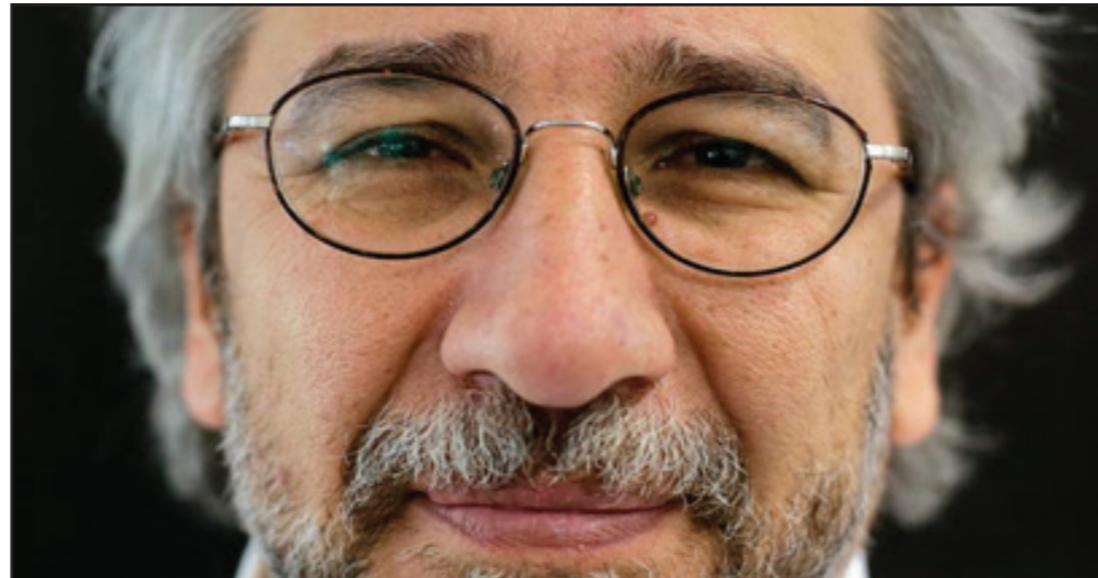
سال زندان محکوم شد. دوندار یکی از اولین روزنامه نگاران ترک بود که در سال ۲۰۱۵ شواهد

و تصاویری از فروش سلاح و سوخت موتر از سوی دولت ترکیه به گروه‌های اسلام‌گرای افراطی در سوریه، از جمله داعش را منتشر کرد. او پس از انتشار چندین گزارش متهم به جاسوسی شد و مخفیانه به آلمان گریخت. او پیش از سفر به آلمان مورد یک سوء قصد نافرجام قرار گرفت. رجب طیب اردوغان، رئیس جمهور ترکیه در واکنش به مدارک و تصاویری که این روزنامه‌نگار منتشر کرده بود هشدار داد که دوندار «هزینه سنگینی» خواهد پرداخت. آخرین جلسه دادگاه در استانبول بدون حضور متهم و وکلای او برگزار شد. وکلاي این روزنامه نگار با سابقه اعلام کرده‌اند که دادگاه جان دوندار کاملاً سیاسی است و دادگاه تنها مقاصد سیاسی و مورد نظر دولت را دنبال می‌کند و به همین دلیل مشروع نیست. دادگاه دوندار را به جرم «دسترسی به اسرار دولتی به منظور جاسوسی» به ۱۸ سال و ۹ ماه و به دلیل «عضویت در گروه تروریستی» به هشت سال و ۹ ماه زندان محکوم کرد.