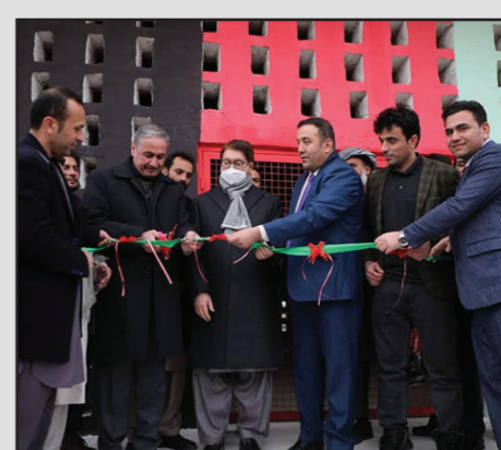
ظرفیت تبدیل ۱۰ تن انگور را به کشمش در یک نوبت دارند.

در خبرنامه نوشته شده که این کشمش خانه ها در ولسوالی های نهرشاهی، دهدادی، شولگره، مارمل، چهاربولک، چمتال، دولت آباد، کشنده، بلخ، کلدار و شورته ساخته شده است. هر یک از این کشمش خانه ها ظرفیت تبدیل ۱۰ تن انگور را به کشمش در یک نوبت دارند.