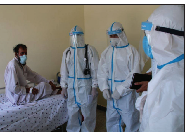
امور صحنی، امکانات بیشتری آماده خواهد شد. وی افزود که کمیته های توسعه همکاری بین افغانستان و ازبکستان نیز تشکیل شده است، که بطور منظم کارهای خود را به پیش می برد.

این وزارت همچنین نوشته است که در ۲۴ ساعت گذشته از ۲۰۵۷ فرد مشکوک آزمایش گرفته شده که نتیجه ۲۷۱ فرد مثبت شناسایی شده اند.