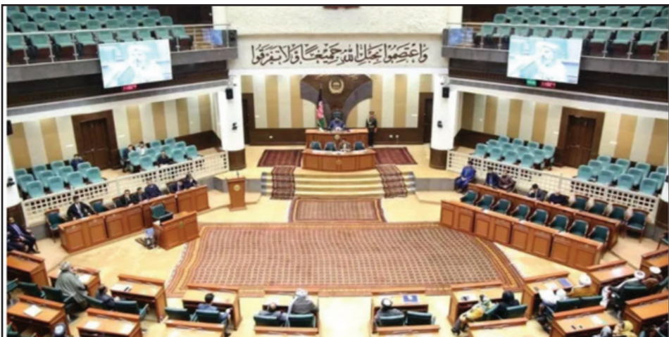
Large assembly hall with many people.

مشرانوچرگه، ضمن حمایت از پیشنهاد حکومت مبنی بر برگزاری مراحل بعدی مذاکرات در داخل کشور، از هیأت‌های دوطرف خواستند که به منظور قطع فشار خارجی‌ها در این روند، مرحله بعدی را در داخل کشور به پیش ببرند.