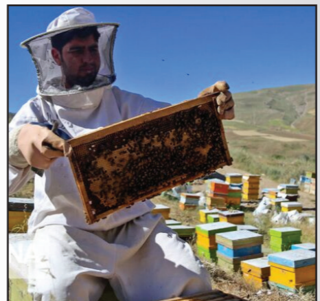
Beekeeper with a beehive.

مهم داشته‌اند. ولایت پکتیا در حوزه‌ی جنوب‌شرق کشور موقعیت دارد.