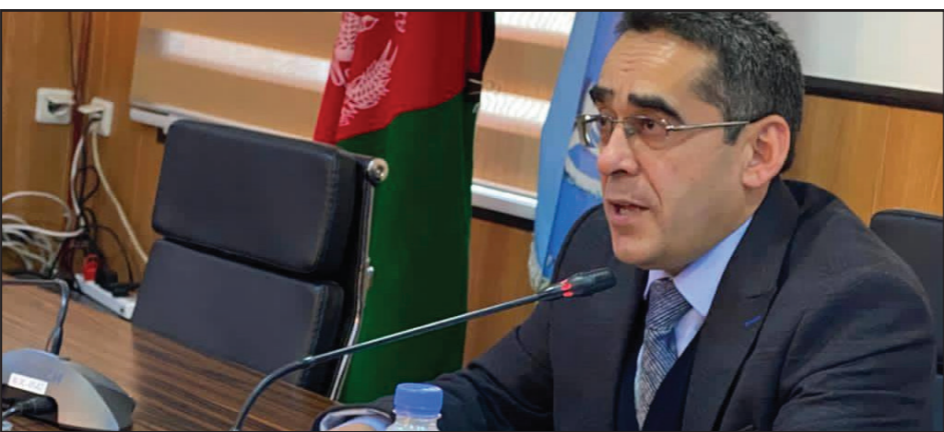
Man speaking at a podium.

وزارت صحت عامه اعلام کرده است که اداره انکشافی ایالات متحده امریکا در این قسمت ساخت چهار باب کارخانه تولید اکسیجن با این وزارت همکاری می‌کند.