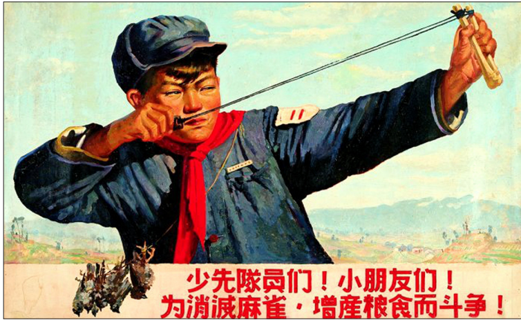
少先队员们！小朋友们！为消灭麻雀，增产粮食而斗争！