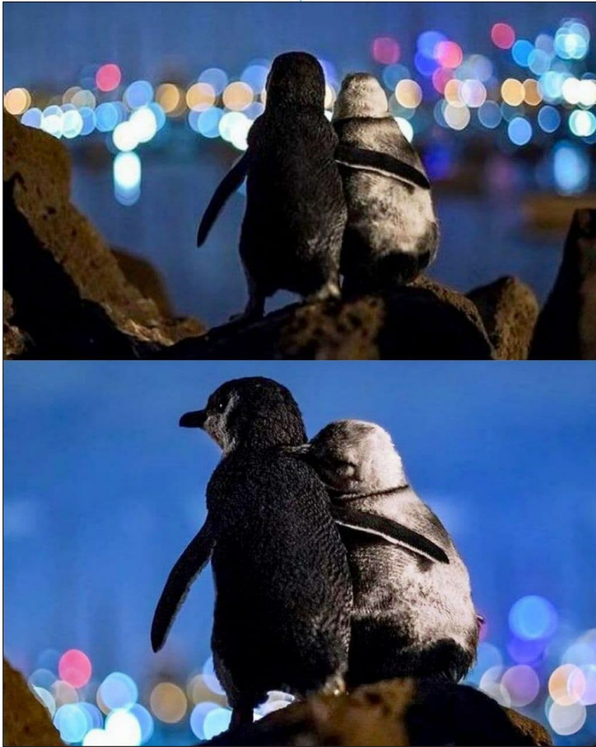
عکس دو پنگوئن عاشق که شانه به شانه به افق ملبورن خیره شده اند