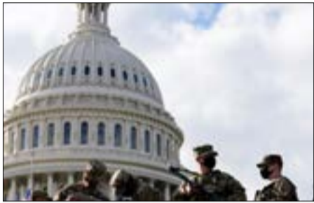
و مرور بسته شده اند و حضور سنگین نظامیان در مرکز شهر، چهره پایتخت آمریکا را تغییر داده است.

اعزام شده اند به ۲۵ هزار نفر افزایش یافته است که دو و نیم برابر بیشتر از مراسم تحلیف سال‌های گذشته است. مراسم سوگند جو بایدن به عنوان رییس‌جمهوری جدید ایالات متحده چهارشنبه، بیستم جنوری، اول بهمن برگزار می‌شود.