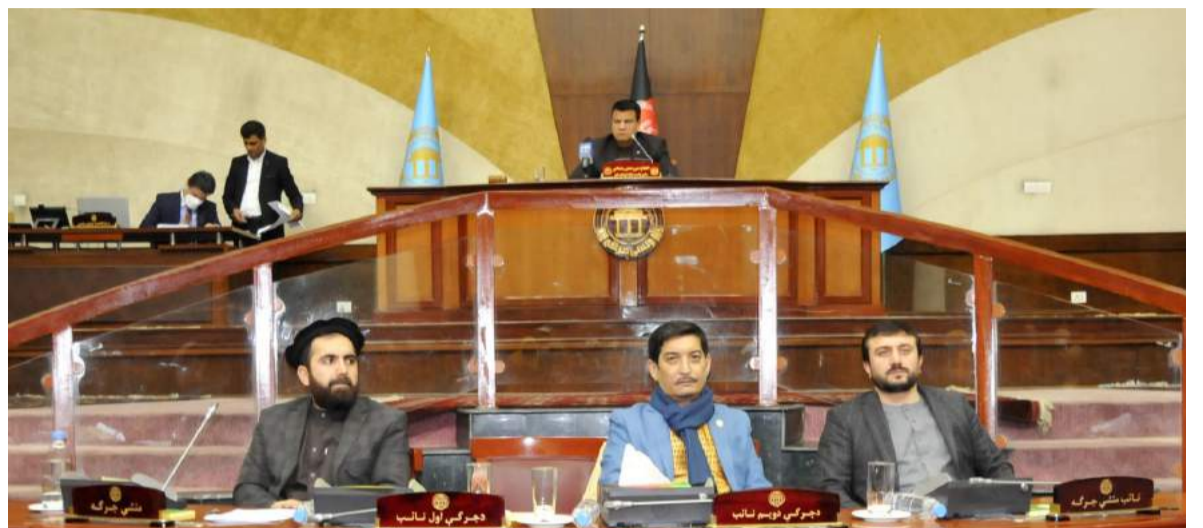
تقابل ادمدار قوه‌های اجراییه و مقننه؛