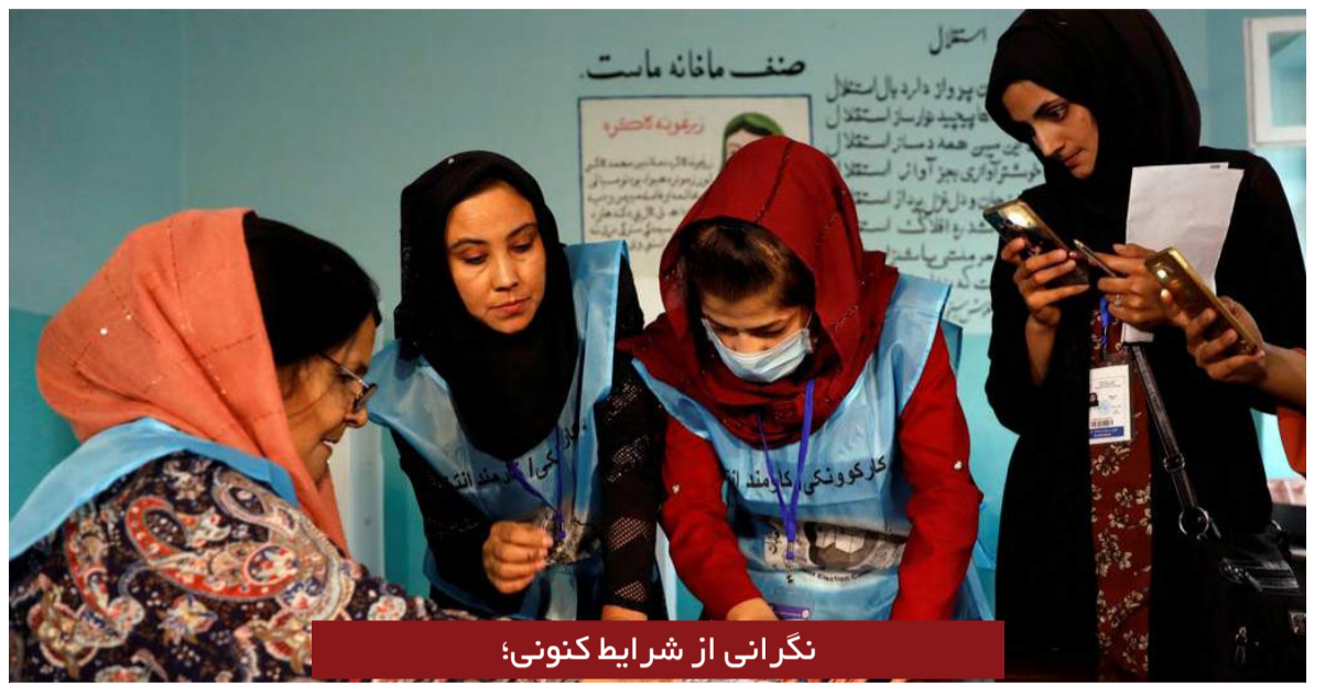
نگرانی از شرایط کنونی؛