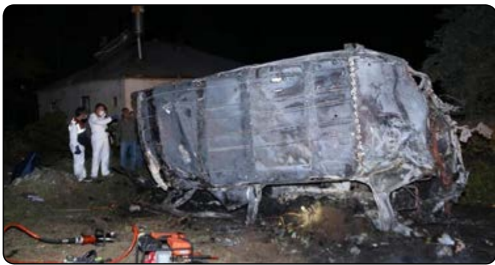
در پی سقوط یک دستگاه موتور حامل مهاجران غیرقانونی به داخل دره و آتش گرفتن آن، دست کم ۱۲ نفر کشته و

۲۶ نفر زخمی شدند. این حادثه در نخستین ساعات بامداد روز یکشنبه ۲۰ سرطان در منطقه مرادیه ولایت واک، در نزدیکی مرز ایران روی داده است. به گفته ولسوال شهر واک ۱۱ نفر از جانبازگان این حادثه مهاجران غیرقانونی بودند و نفر دوازدهم نیز سفر غیرقانونی آنها را ترتیب داده بود. رسانه های ترکیه می گویند که سرشناسان این موتورعدمتا مهاجرانی از افغانستان، پاکستان و بنگلادش بودند. هنوز هویت قربانیان مشخص نشده اما صاحب موتور نیز دستگیر شده است. شهر واک به دلیل نزدیکی به مرز ایران، یکی از مهمترین مسیرهای حرکت مهاجران غیرقانونی از ایران، افغانستان و پاکستان به سمت اروپاست. سال گذشته نیز غرق شدن یک کشتی حامل مهاجران در دریایچه واک ۶۰ کشته برجای گذاشت. تنها در سال ۲۰۲۰ میلادی ۸۰ مهاجر غیرقانونی در این شهر جان خود را از دست داده اند.