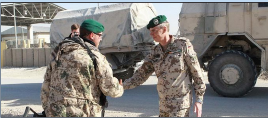
سربازان اردوی آلمان مستقر در افغانستان در ماه جون امسال افغانستان را ترک گفتند.

سال‌های حضور نظامی آلمان در ولایت کندز در ماه نوامبر سال گذشته در این ولایت به پایان رسید. آخرین گروه ۱۰۰ نفری سربازان آلمانی رسماً «کمپ پامیر» را در سال ۲۰۲۰ ترک کردند. کندز به مکان نمادین برای اردوی آلمان تبدیل شد که با تعداد زیادی از سربازان کشته شده و حمله هوایی ویرانگر ناتو به دستور جنرال آلمانی در سال ۲۰۰۹ همراه بود. در شهر کندز، در چارچوب ماموریت ناتو «آموزش، مشاوره، کمک» (TAA)، سربازان آلمانی به عنوان مربی نیروهای افغان مستقر شده بودند. بین سال‌های ۲۰۰۳ تا ۲۰۱۳، نیروهای مسلح آلمان به عنوان بخشی از نیروهای