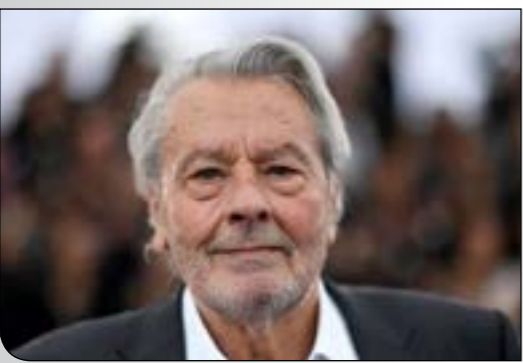
جواب شطرنج ۳۰۶

حضور دلون در آمریکا، برای وی یک شکست محسوب می‌شود. او در دهه ۱۹۶۰ و زمانی که در فرانسه یک ستاره مهم محسوب می‌شد، تلاش کرد راه خود را به هالیوود باز کند و موفقیت خود را در آمریکا ادامه دهد. او قراردادی طولانی مدت با کمپانی فلمسازی مترو گلدوین مایر نوشت و در چندین فیلم بازی کرد که به سختی در گیشه فروش داشتند. او سپس قرارداد خود را فسخ می‌کند و به فرانسه بازمی‌گردد که موفقیتی دوباره را برای وی به همراه داشت. مدتی پیش بود که آلن دلون ۸۵ ساله اعلام کرد هنوز امیدوار است در یک اثر خوب دیگر به عنوان آخرین فیلم سینمایی اش بازی کند. گفتنی است که تاکنون او در بیش از ۸۰ فیلم سینمایی ایفای نقش کرده است.