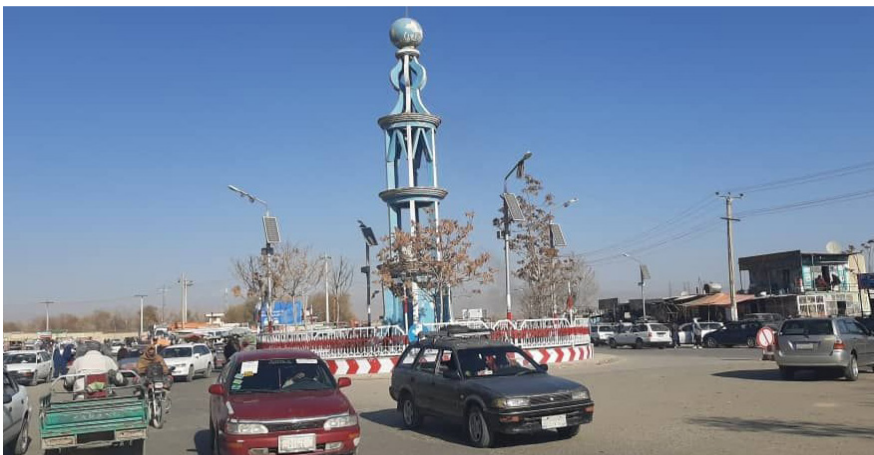
۸ صبح، لوگر

شماری از باشنده گان بی‌بضاعت در لوگر در کنار افزایش بیکاری، فقر و تنگ‌دستی، از توزیع غیرعادلانه کمک‌های بشردوستانه در این ولایت شکایت دارند. آنان طالبان را به دست‌برد در این کمک‌ها متهم می‌کنند و خواهان توزیع عادلانه کمک‌های غذایی و غیرغذایی به افراد مستحق‌اند. آنان می‌گویند که کمک‌های بشردوستانه در این ولایت به نیازمندان نمی‌رسد، بلکه تنها افراد وابسته به طالبان و سرمایه‌داران می‌توانند از این کمک‌ها مستفید می‌شوند. بیشتر افراد بی‌بضاعتی که برای دریافت کمک به درب اداره‌های مدرسان و مقام‌های محلی طالبان در لوگر مراجعه کرده‌اند، خاطر نشان می‌سازند که موفق به دریافت حتی یک کیلوگرام آرد نشده‌اند. مسوولان محلی طالبان در لوگر اما همواره از توزیع عادلانه و شفاف کمک‌ها به افراد مستحق و نیازمند سخن می‌گویند.