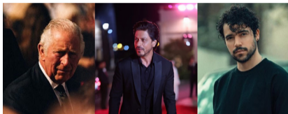
مجلہ امریکایی تایمز لیست افراد تأثیرگذار سال ۲۰۲۳ را اعلام کردہ کہ در میان آنان شخصیتهایی از ایران،

ہند و پاکستان بہ چشم می خورد. تایمز این فہرست را روز پنج شنبہ، ۱۳ اپریل، ہمہ گانی کردہ است. شاہرخ خان، ہنرپیشہ سینمای ہند، شروین حاجی پور، خالق آہنگ مشہور اعتراضی «برای»، نیلوفر حامدی و الاہہ محمدی، خبرنگاران زندانی در ایران، در میان ۱۰۰ شخصیت تأثیرگذار در جہان قرار دارند. چارلز سوم، شاہ بریتانیا، سلمان رشدی، نویسنده و شری رحمان، وزیر تغییرات اقلیمی