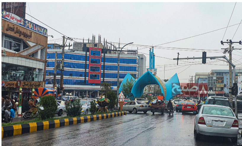
۸ صبح، هرات

مالکان رستورانها نیز منع ورود زنان به رستورانها را به معنای ورشکست شدن کاروبار خود تعبیر می کنند. رستورانداران خاطر نشان می سازند که تطبیق این تصمیم طالبان بیش از ۵۰ درصد کاروبار رستورانهای هرات را با رکود مواجه می سازد.