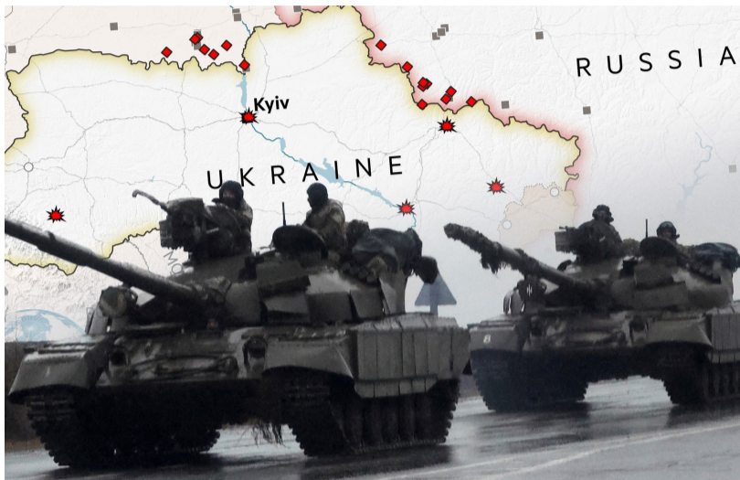
نویسنده: شجاع‌الدین امینی

به انزوا راندن روسیه، به این ملاحظات چندان اهتمام نمی‌ورزند و کشورهای اروپای شرقی را فارغ از ضعف و قوت آن‌ها به عضویت در ناتو فرا می‌خوانند. به باور مخالفان، این کشورها ممکن است در معرض حمله نظامی روسیه قرار گیرند و سازمان ناتو نتواند به حمایت از آن‌ها وارد میدان نبرد با روسیه شود. در این صورت اعتبار و هیمنه ناتو در هم خواهد شکست و میدان برای روسیه بیشتر باز خواهد شد. به فرض، اگر ناتو به حمایت از کشورهای هواخواه خود در اروپای شرقی وارد جنگ با روسیه شود، ممکن است این جنگ بعد بین‌المللی به خود بگیرد که نه به سود روسیه است و نه هم به سود ناتو. جنگ اوکراین می‌تواند نمونه خوبی باشد مبنی بر تأیید مدعای مخالفان.