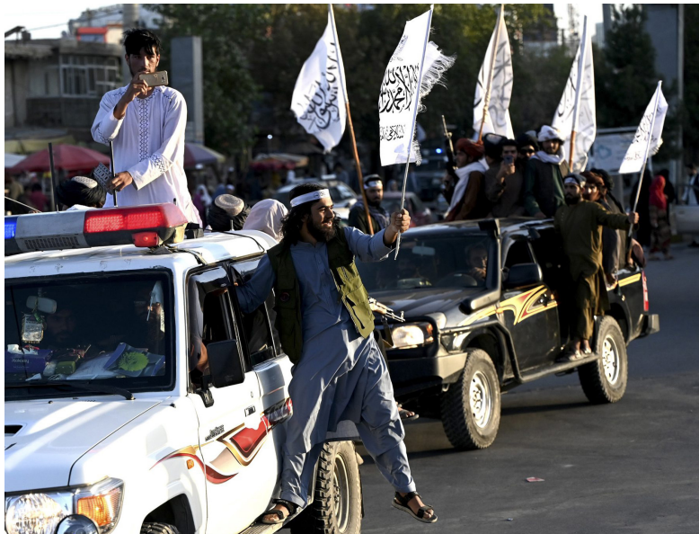
کج شجاع‌الدین امینی

به‌ویژه روسیه، جمهوری‌های آسیای میانه، ایران، پاکستان و... به‌شدت از وضع جاری در افغانستان شکایت دارند و حضور و فعالیت گروه‌های تروریستی را بیش از گذشته برجسته می‌خوانند. برای نمونه، آنتولی سیدوروف، رییس ستاد مشترک سازمان پیمان امنیت جمعی، در نیمه فبروری سال روان، مدعی شد که رقم جنگ‌جویان داعش در افغانستان به شش هزار و ۵۰۰ تن رسیده و از این میان، چهار هزار تن در نقاط مشترک مرزی میان تاجیکستان و افغانستان مستقر شده‌اند. همین‌طور، حسین امیرعبداللہیان، وزیر خارجه جمهوری اسلامی ایران، چندی قبل مدعی شد که جنگ‌جویان و فرماندهان کارکشته داعش از سوریه و عراق به افغانستان منتقل شده‌اند.